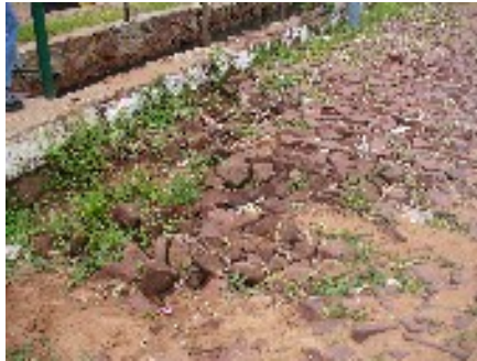
Hundimiento de empedrado Avda. Toledo Cañada