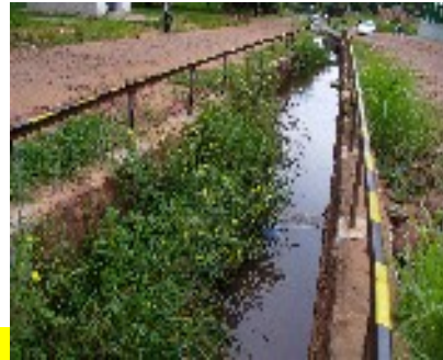
Falta de limpieza en canal Avda. Toledo Cañada