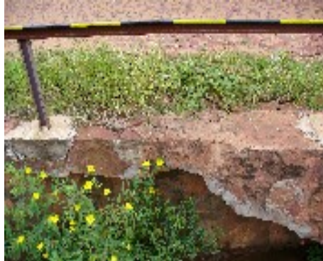
Rotura en muro de piedra Avda Toledo Cañada, afectando estabilidad del muro en ese sector, peligro de ruina.