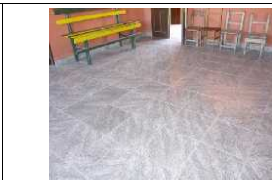
Pisos y zócalos ejecutados con el tipo cerámico, habiéndose ofertado piso y zócalo calcáreo.