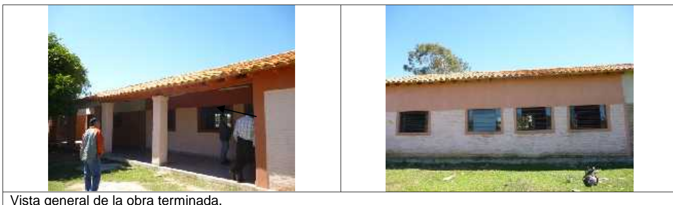
Vista general de la obra terminada.