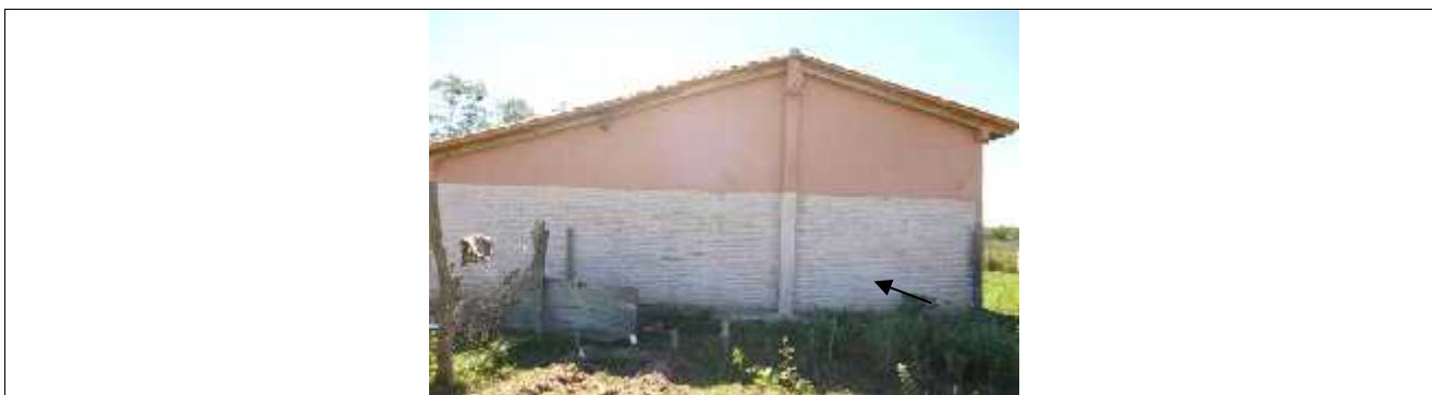
Presencia de humedad en las paredes externas de ladrillo común a la vista, pintadas con 1 mano de pintura a la cal.