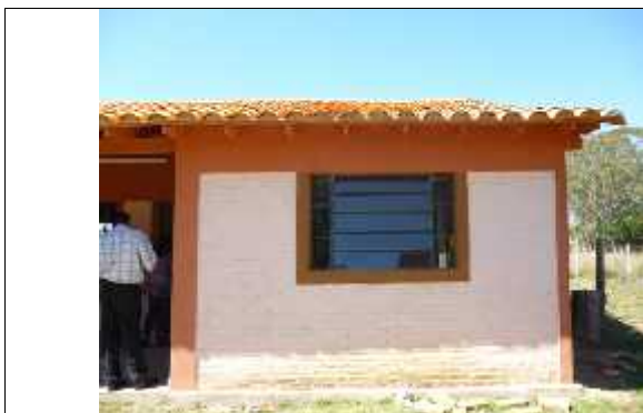
Aberturas metálicas con pintura anticorrosiva , sin pintura sintética..