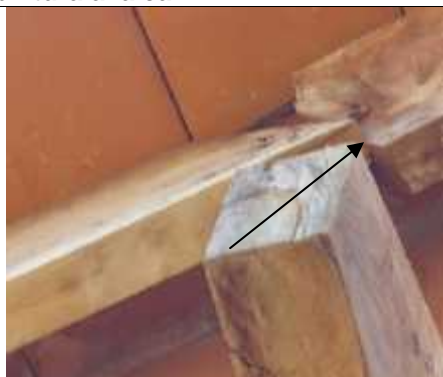
Mala colocación de tirantes en la unión sobre la viga de madera sin trabas, asentada una sobre el borde de la otra. En los aleros sin tratamiento de protección.