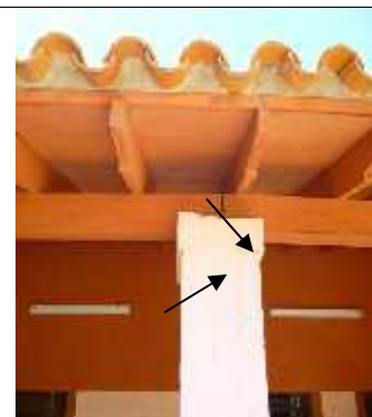
Las vigas de madera colocadas en remplazo de las de H º A º no contaba con planchuela de sujeción. Los capiteles de los pilares fueron realizados con ladrillos comunes y no con H º A º ofertado