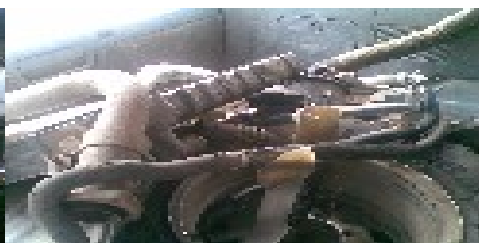
Foto parte trasera de la cabina, donde se encuentran parte de las piezas de la camioneta.