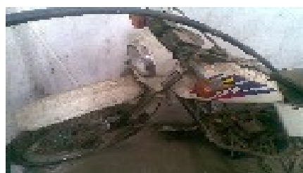
Foto en donde se puede visualizar que la motocicleta ya no tiene motor.

Referente a este punto la Municipalidad manifiesta en el descargo que "...se seguirá el proceso de remate como establece la normativa, y se comunicará a la Contraloría General de la República con los documentos correspondiente para los fines que hubiere lugar..."