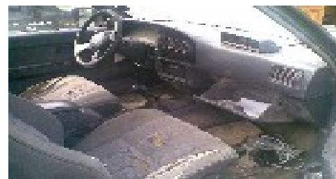
Foto de la cabina del vehículo, totalmente dañado los asientos.