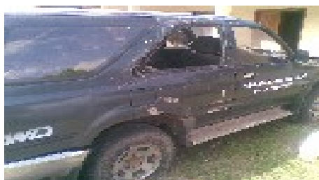
Foto parte lateral, sin el vidrio trasero, por donde ingresa agua los días de lluvia.