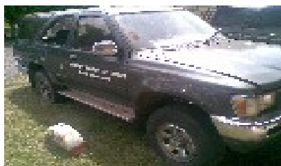
Foto parte lateral de la camioneta expuesta al sol y a la lluvia.

Nuestra Misión: Ejercer el control gubernamental propiciando la mejora continua de las Instituciones en beneficio de la ciudadanía.-