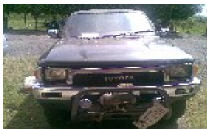
Foto parte frontal del vehículo municipal, varado el patio municipal.

A continuación se puede visualizar el estado de la camioneta y la motocicleta mencionada: