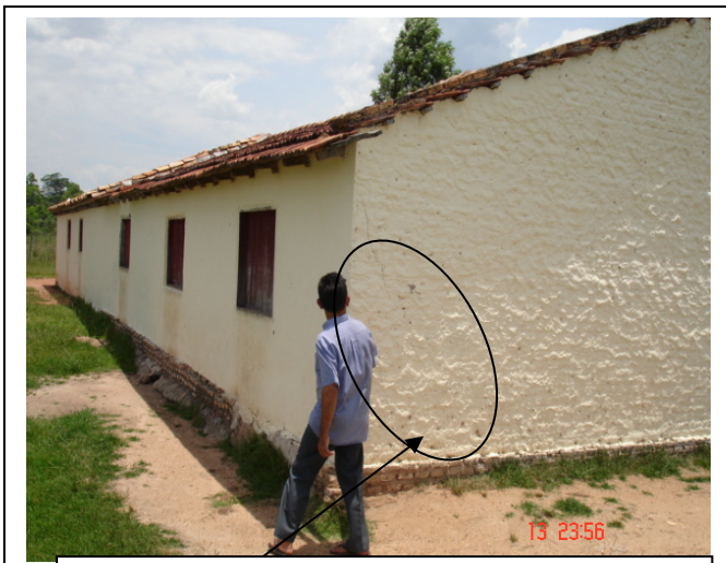
Fachada posterior Escuela Jhugua Guazú. Detalle de fisuras por asiento de base fundación.

Durante la verificación In situ a los diferentes emprendimientos encarados por la Municipalidad a instancias de Comisiones Civiles, se detectaron que algunas obras presentan vicios de obra, así como edificaciones sin terminación plena de sus rubros de obra constitutivos.