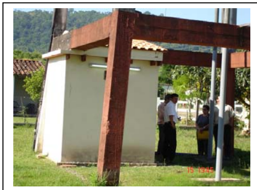
Detalle de caseta para comando del pozo de agua. Difiere de las especificaciones técnicas comprometidas en contrato.

Se desprende de esto que aproximadamente el 67% de las obras (6/9) incumplieron con las Especificaciones Técnicas comprometidas para la transferencia de fondos de la Municipalidad; ni ésta realizó requerimiento o exigencia de su cumplimiento, además de desplazamiento de plazos en su ejecución a pesar de haberse transferido íntegramente los montos aplicados. (ver Anexo C2)