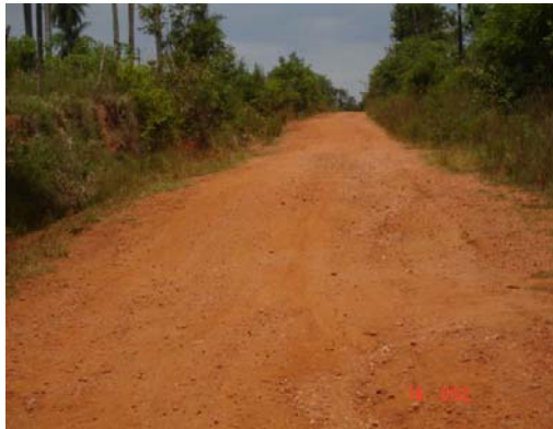
Perspectiva camino con capa de ripio

Para el caso de ambas obras, la Cláusula 3) Alcance del Contrato establece: “El alcance de los trabajos a realizar está dado por los rubros escritos de la planilla de Presupuesto según las cantidades expresamente mencionadas en la misma” ; de ahí que las diferencias resultaran de la comparación de las mediciones realizadas con los diferentes rubros de dichas obras.