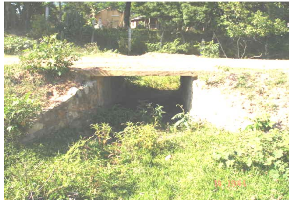
Puente camino a vertedero.

El incumplimiento de la Cl. 3) relativa al alcance de los trabajos por parte de la fiscalización, ha permitido el pago de Gs. 10.845.070 (guaraníes diez millones ochocientos cuarenta y cinco mil setenta) por trabajos y provisiones no realizadas y que no se ajustan a las especificaciones técnicas estipuladas.