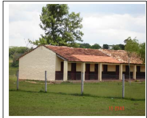
Reposición de techo en Escuela Jhugua Guazú

Asimismo, la verificación in situ permitió observar vicios de obra, o porción de obra sin terminación plena de sus rubros componentes. No fue presentada la Recepción final de obras con su correspondiente ajuste final de cuentas con el contratista. Dicha desatención institucional, falta de fiscalización y seguimiento genero diferencias por valor aproximado al 22% del total desembolsado (ver Anexo C2) que requieren ser acordadas, en c/u de los casos, con el contratista para su resolución.