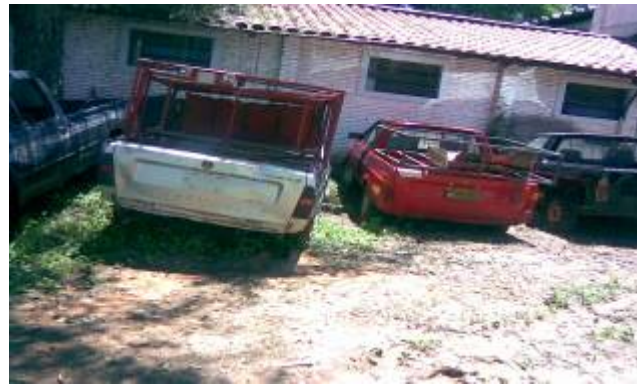
Estos vehículos se encuentran en el predio de la Dirección de Extensión Agraria del MAG

Con relación al punto, la institución examinada no ha presentado descargo alguno a la observación comunicada en su oportunidad, este equipo auditor se ratifica en los términos de la misma.