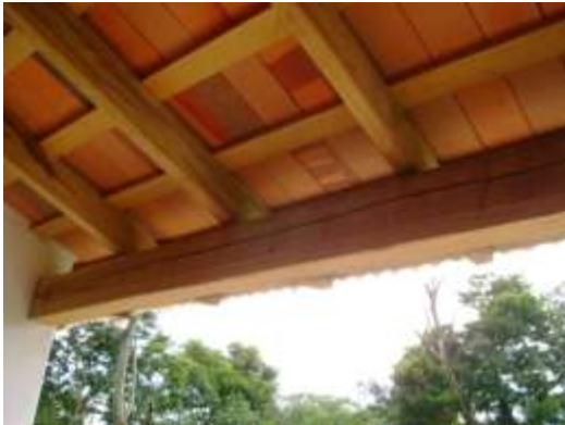
Viga con rajadura longitudinal