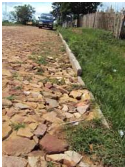
Lavado del relleno entre piedras.