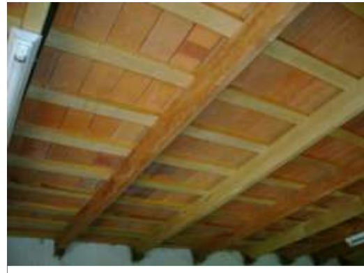
Tirantes con empalme en el apoyo Tejuelas de color no uniforme