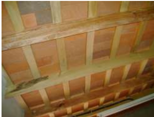
Tejuelas quemadas. Tirantes manchados