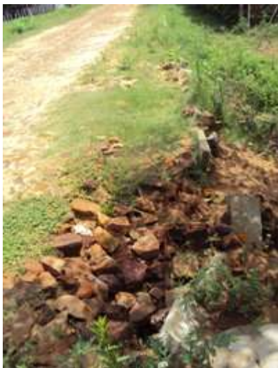
Desplazamiento de piedras y Cordones.

4.1. Empedrado Calle Adela Speratti: El pavimento tipo empedrado presenta lavado del material entre piedras y del colchón de arena, lo que produce a la vez inestabilidad y desplazamiento de las piedras y cordones. Esta situación se debe a la casi inexistencia de piedra triturada en las rendijas, falta de adecuada compactación, falta de soporte en la cara posterior y falta de empotramiento de los cordones.