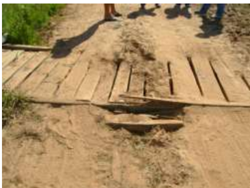
Viga de apoyo rota

4.3. Construcción de dos puentes - Cia. Sta. Catalina - Ycuá Porá y Toropi Ruguá: Se verificó la existencia de un puente en la Compañía Santa Catalina, en la cercanía del arroyo Aguará– syry. La viga de apoyo está rota por carecer de una estructura adecuada, y los tablones mal colocados, sin sujeción adecuada.