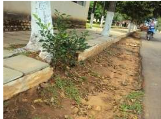
Levantamiento de baldosones

4.3. Construcción de dos puentes - Cia. Sta. Catalina - Ycuá Porá y Toropi Ruguá: Se verificó la existencia de un puente en la Compañía Santa Catalina, en la cercanía del arroyo Aguará– syry. La viga de apoyo está rota por carecer de una estructura adecuada, y los tablones mal colocados, sin sujeción adecuada.