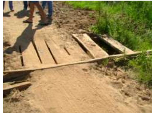
Tablones mal colocados