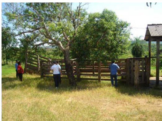
Adecuación de la Matadería

En las fotos se pueden observar la COLOCACION CERCADO PERIMETRAL DE MADERA EN LA MATADERIA - CRUCE YBYRARBANA, construidas por la Municipalidad