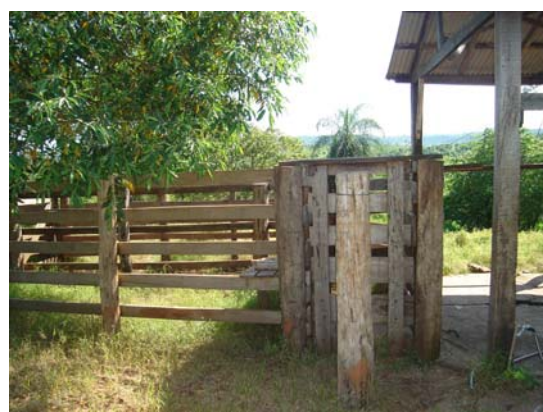
Firmes y tablas conforman el cercado