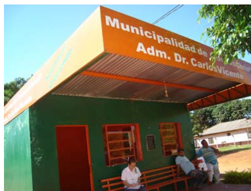
Parada de Taxi en la calle Mariscal Estigarribia

Con relación al punto, la Administración Municipal a través del Descargo a la Comunicación de Observaciones ha manifestado, entre otras cosas, cuanto sigue: "a) En materia de precios referenciales, en todas las zonas del distrito y otros colindantes los precios referenciales son por