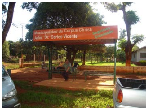
Parada de Ómnibus en la ciudad de Corpus Christi

En las fotos se pueden observar las paradas de Ómnibus construidas por la Municipalidad