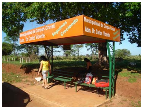
Parada de Ómnibus en Cruce Guarani

La Administración Municipal a través del Descargo a la Comunicación de Observaciones ha manifestado, entre otras cosas, cuanto sigue: “En lo referente a las mediciones realizadas por el Equipo Auditor, la Intendencia Municipal dispuso la verificación in situ de las obras” (...).El resultado de la verificación dispuesta por la intendencia municipal presenta las misma diferencia encontrada por esta auditoría; por lo tanto el equipo auditor se ratifica en la observación.