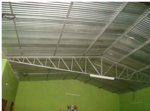
Cobertura Metálica – Cabriadas, Correas con Chapas de Zinc

En las fotos se pueden observar la COBERTURA METÁLICA DE LA IGLESIA VIRGEN DE FATIMA, construidas por la Municipalidad.