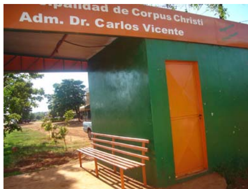
Parada de Taxi en el Cruce Guarani

La Administración Municipal, ha dado contestación a través del Descargo a la Comunicación de Observaciones, cuanto sigue: "a) En materia de precios referenciales, en todas las zonas del distrito y otros colindantes los precios referenciales son por encima de los expuestos por el grupo de auditores, basado en los costos adicionales por traslado, sumado a ello el difícil acceso a las zonas de obras. b) La misma se halla en proceso de verificación y se constata diferencias puntualizadas por el Equipo Auditor, por lo que se procedió a la notificación de la firma responsable a fin de adecuar la obra a las especificaciones técnicas del anteproyecto especificado en las cláusulas contractuales" . El equipo auditor realizó estudio de mercado de los materiales de construcción, componentes de los rubros ejecutados puestos en obra, incluido los costos de traslado. Por tanto, esta auditoría se ratifica en la observación.