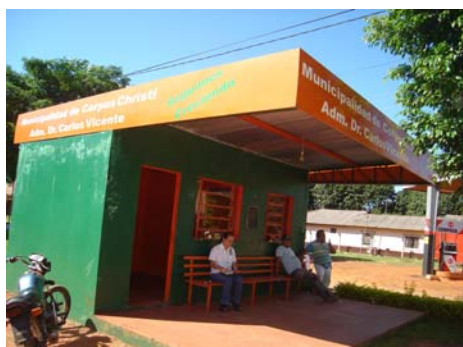
Se puede observar la pintura de la pared deteriorada

En las fotos se pueden observar la Parada de Taxi en la calle Mariscal Estigarribia