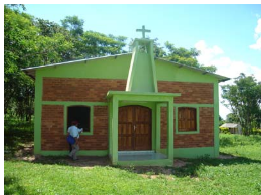
Vista exterior de la Iglesia Virgen de Fátima

Con relación al punto, la Administración Municipal ha dado contestación a través del Descargo a la Comunicación de Observaciones, entre otras cosas, cuanto sigue: “ En materia de precios referenciales, en todas las zonas del distrito y otros colindantes los precios referenciales son por encima de los expuestos por el grupo de auditores, basado en los costos adicionales por traslado, sumado a ello el difícil acceso a las zonas de obra.