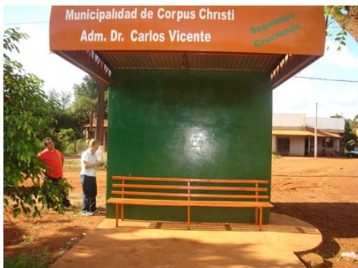
La parada de taxi se encuentra sin uso hasta la fecha de verificación

En las fotos se pueden observar la Parada de Taxi en el Cruce Guarani