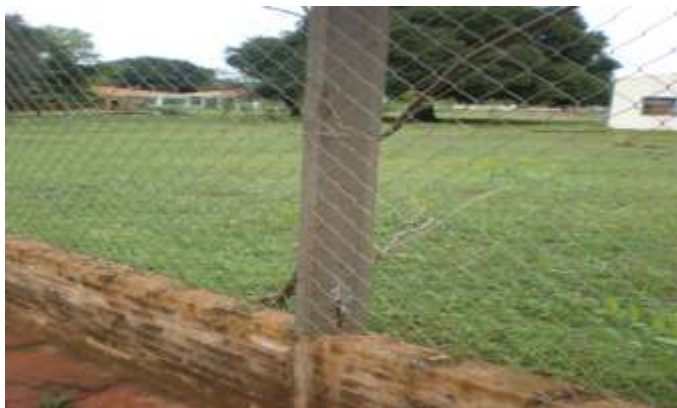
Fisuras en postes de hormigón