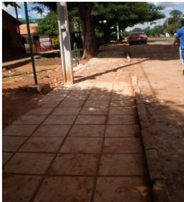
Salida de la ciudad, mala colocación de cordones de hormigón que en partes ya están rotos.

Se puede observar que el empedrado construido al costado del Polideportivo Municipal se encontraba descalzado y con ausencia de ripio y compactación