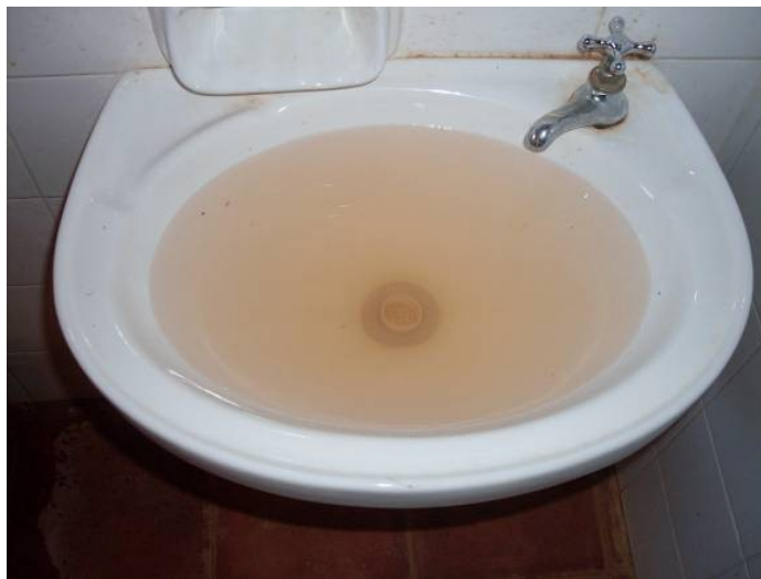
Aspecto turbio del agua con sólidos totales (ver filmación)

Como se observa en el cuadro anterior, el agua analizada en fecha 06/11/08 no es apta para el consumo humano. Luego de 12 y 18 días respectivamente, se efectúan nuevos análisis los cuales demuestran que el agua reúne las condiciones de potabilidad exigidas en las diversas disposiciones que rigen la materia. Resulta llamativo que, 4 días después del último análisis (tipo bacteriológico), el equipo auditor ha efectuado una verificación in situ en la citada escuela (Acta CGR N° 55/08 de fecha 28/11/08), donde el agua presenta un aspecto turbio y restos de arena.